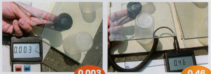
NTサーモバランスを塗装した単板ガラス